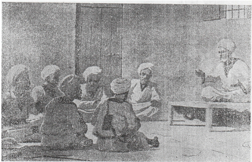
السيد عبد الله التعايشي خليفة المهدي في مجلس قضائه

المسألة السابعة - من يرسل الأمتعة يبيعها خفية للكفرة طمعا في كثرة المال بعد أن سمع المنع والتحذير - أقول ان ثبت هذا بينة يؤخذ ماله لبيت المال ويترك له نفقته فقط - وان عاد ثانيا تقطع يده أو يحبس لغاية فتح المدينة والله أعلم بالصواب « اهـ